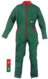
Combinaison enfant (CORFOU)