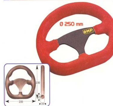
Volant Formula Quadro