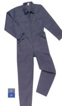
Combinaison adulte (COLOGNE)