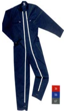
Combinaison adulte (MILLAU)