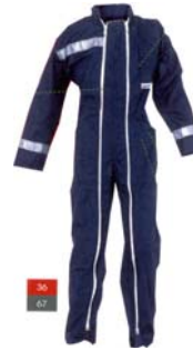
Combinaison enfant (MOSCOU)