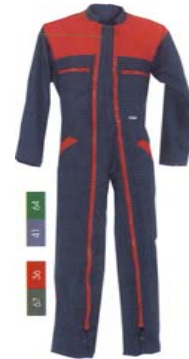
Combinaison adulte (MEXICO)