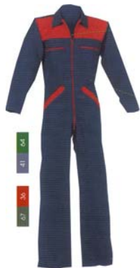
Combinaison adulte (COLOMBO)